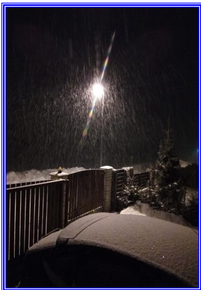
Chumelí se chumelí