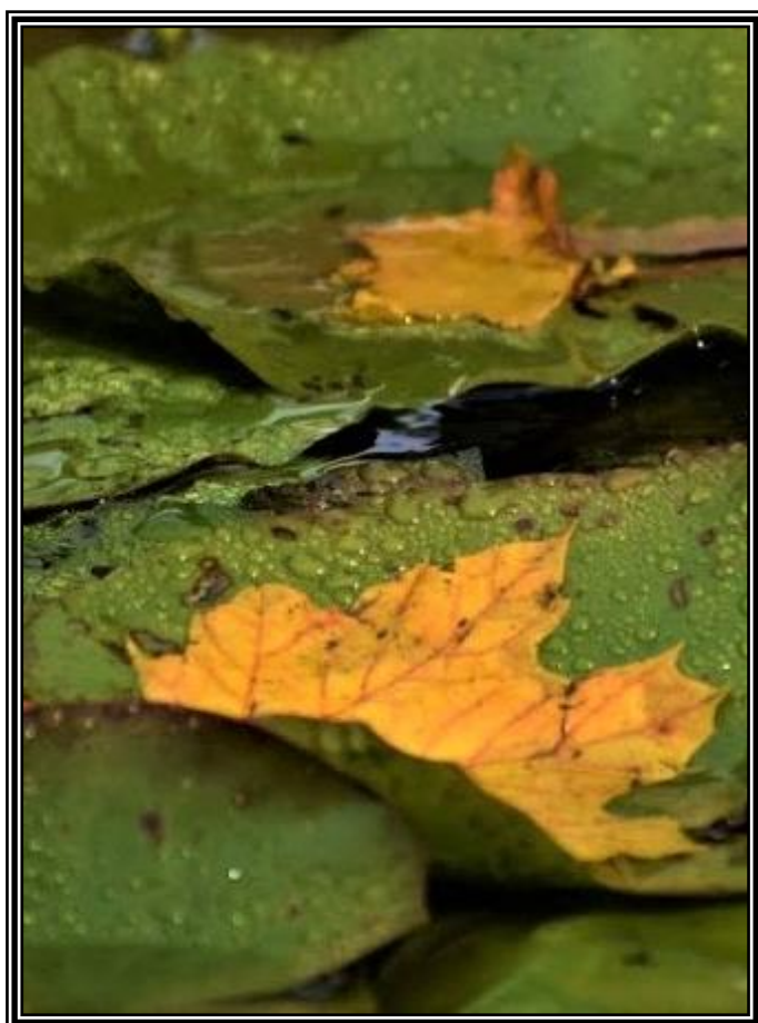
Listy na vodě