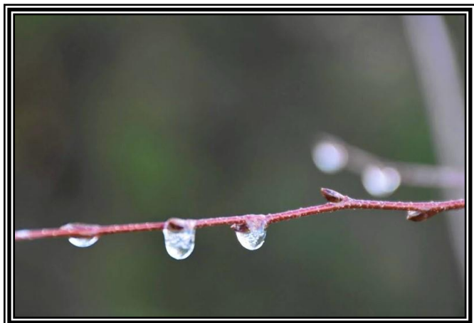
Tunel, Kapky