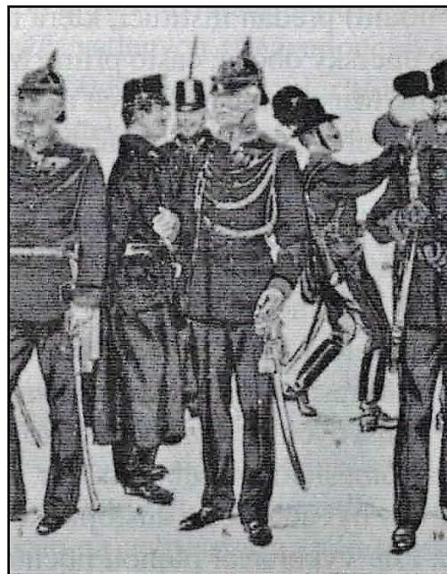
Četnické uniformy z konce 19. století

V novověku začalo vznikat také polní četnictvo. V rakouské části monarchie existoval u každého pluku jízdy oddíl granátníků, vybraný ze statnějších jezdců, který plnil úkony polního četnictva.